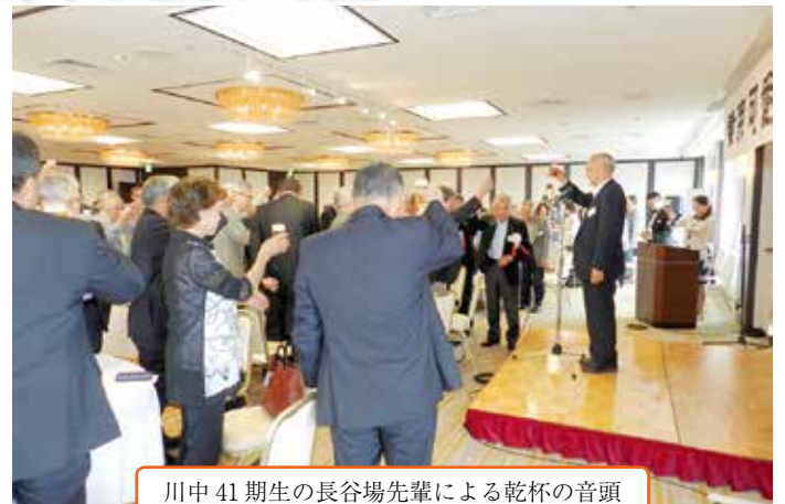
川中 41 期生の長谷場先輩による乾杯の音頭