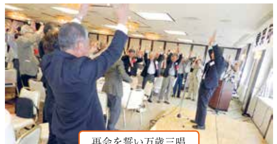
再会を誓い万歳三唱