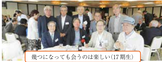
幾つになっても会うのは楽しい(17期生)