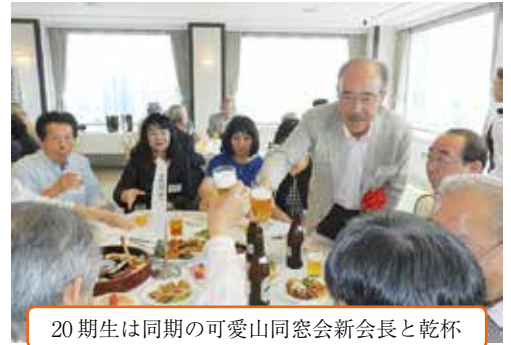
20期生は同期の可愛山同窓会新会長と乾杯