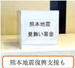
熊本地震復興支援も