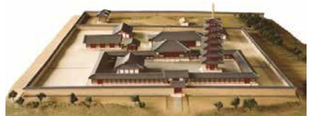
薩摩国分寺推定復元模型（南側より）

史跡公園として整備されるまでの道のりは長く、多くの先人たちの努力が実を結んで完成したことを忘れず、史跡公園を大切にしていきたいものです。