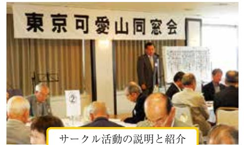
サークル活動の説明と紹介