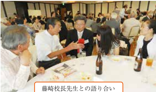
藤崎校長先生との語り合い