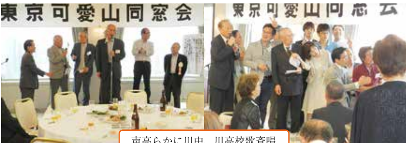
声高らかに川中、川高校歌斉唱