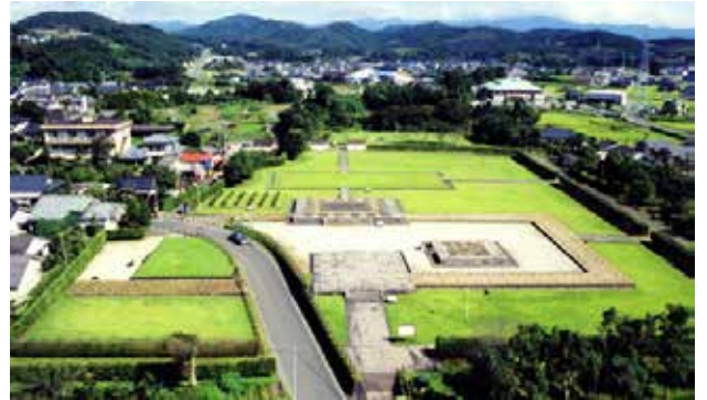
上空から見た薩摩国分寺跡史跡公園（南側より）

歴史資料館からすぐ近くにある薩摩国分寺跡は、資料館が開館した翌年の昭和60年に国指定史跡公園として開園しました。公園は、薩摩国分寺跡の保存と活用のため、地下に残る遺構は覆い土で保存した上で、復元的に施設を整備しています。史跡公園として、教育の場など多くの人々が利用できるような環境にも配慮されています。