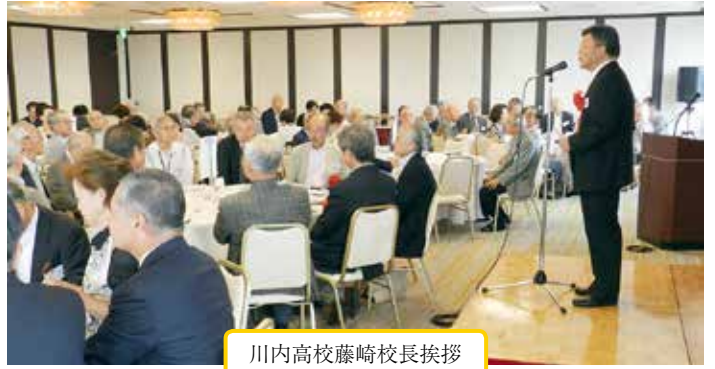
川内高校藤崎校長挨拶