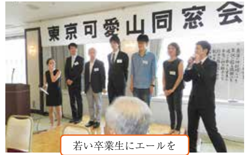
若い卒業生にエールを