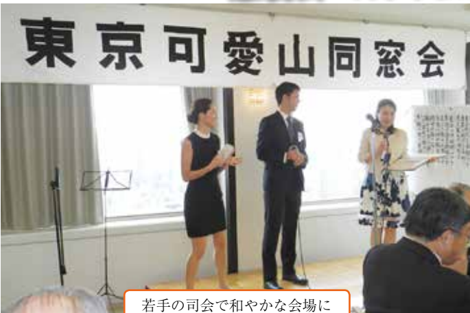
若手の司会で和やかな会場に