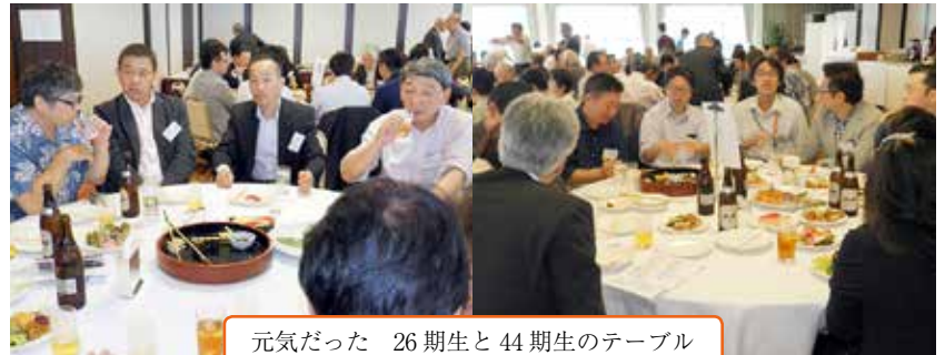
元気だった 26期生と44期生のテーブル