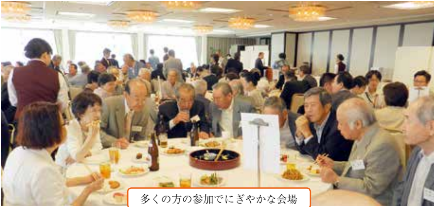
多くの方の参加でにぎやかな会場