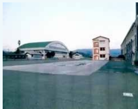
旧校舎解体作業終わる！

(平成 28 年) 9 月頃から始まった旧校舎の解体作業が完了しました。12 月中旬頃から新校舎の建設に入ります。学習環境がますます充実していきます。(「川内高校だより」平成 28 年 11 月 30 日発行号より)